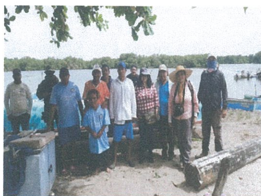
Fotografía Nro. 2: Comunidad Isla Las Casitas