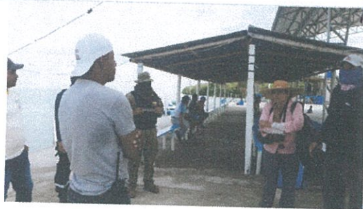
Fotografía Nro. 3: Socialización de las actividades que se estaban realizando es Isla Las Huacas