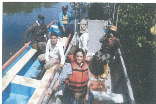
Fotografía Nro. 1: Equipo de técnicos para inspección a los sitios arqueológicos programados..