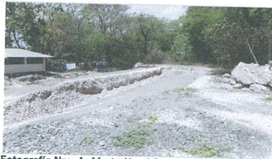
Fotografía Nro. 4: Afectación al Conchal Isla Seca.