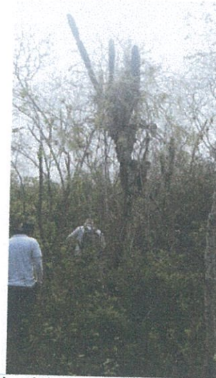
Fotografía Nro. 4: Inspección al sitio Callanca Chico.