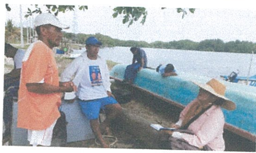
Fotografía Nro. 3: Socialización de las actividades que se estaban realizando es la comunidad Las Casitas.