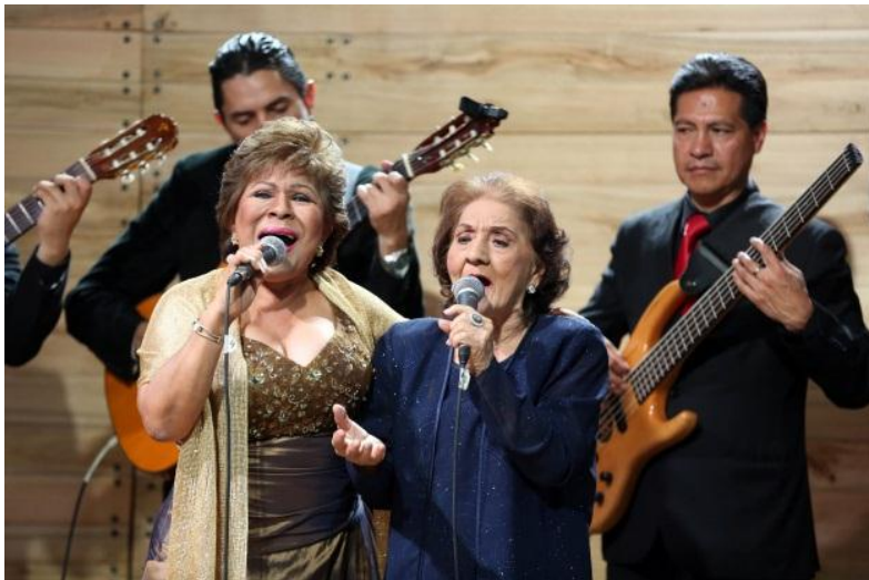
Instituto Nacional de Patrimonio Cultural

Después de más de 2 años de investigación que contó con la participación de historiadores, musicólogos, antropólogos, sociólogos, gestores culturales, con la finalidad de establecer acciones concretas encaminadas a la dinamización, revitalización, transmisión, comunicación, difusión, promoción, fomento y protección, para salvaguardar este patrimonio, realizada por parte del equipo técnico del Patrimonio inmaterial, con el apoyo fundamental de la comunidad, los portadores de esta manifestación, expertos en el tema, en diciembre de 2021; el Pasillo, canción y poesía fue incorporado en la Lista Representativa del Patrimonio Cultural Inmaterial de la UNESCO.