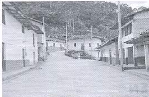
Fotografía 5: Registro fotográfico del contexto urbano arquitectónico.