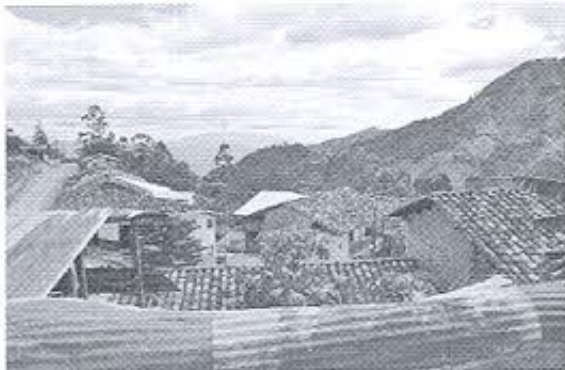
Fotografía 1: Registro fotográfico del entorno natural y urbano.