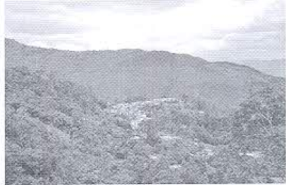
Fotografía 2: Registro fotográfico del entorno natural y urbano.