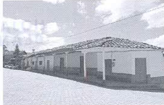
Fotografía 4: Registro fotográfico del contexto urbano arquitectónico.