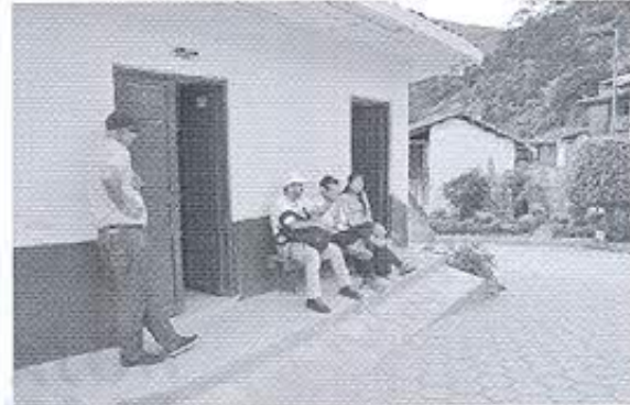
Fotografía 6: Compañeros del equipo de trabajo.