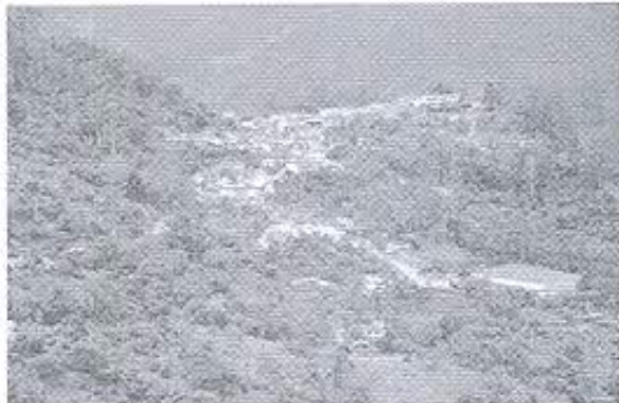
Fotografía 3: Registro fotográfico del entorno natural y urbano.