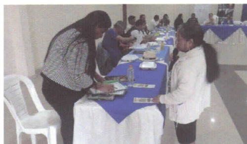
Artesana ASOPROMAHER, entrega oficio a delegada MCE