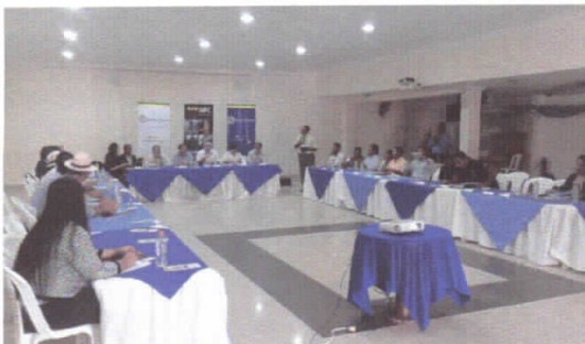
Mesas de actores locales, directivos y delegados.