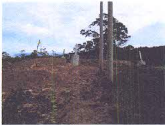
Foto 8.- Torre T278 construida sobre un sitio arqueológico, no se ejecutó rescate y monitoreo.