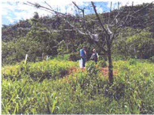
Foto 7.-Torre T266 construida sin monitoreo arqueológico.