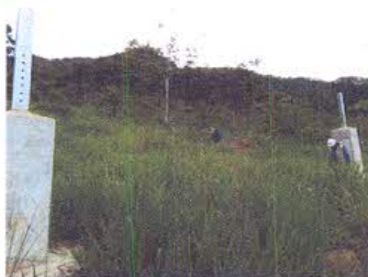
Foto 12.- Las patas de la torre T274 fue construida sobre un sitio arqueológico sin la realización del rescate y monitoreo arqueológico