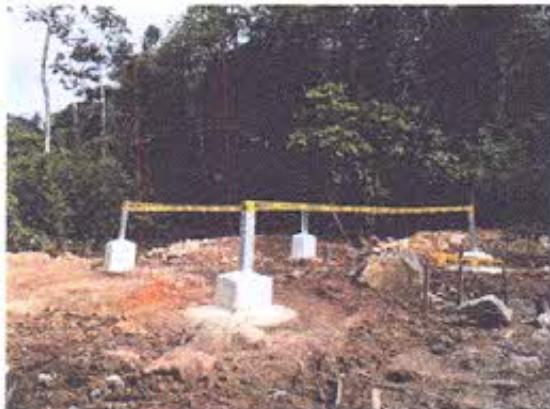
Foto 9.- Torre T277 construida sin la ejecución de un monitoreo arqueológico