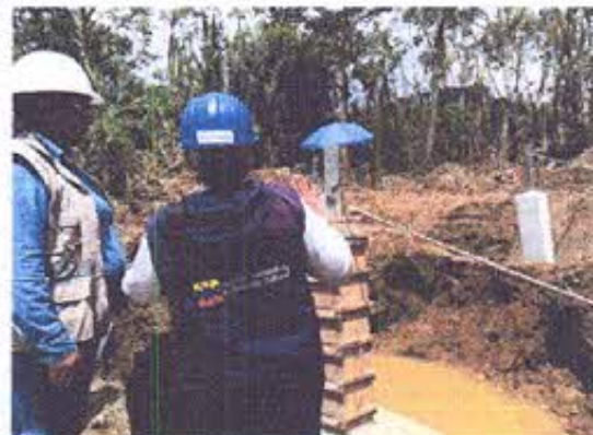
Foto 4.- Torre T256 en proceso de construcción, se realizó monitoreo arqueológico.