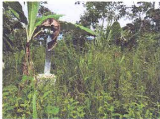
Foto 10.- Área de la torre T276, en donde se registró un sitio arqueológico. La construcción se ejecutó sin el rescate arqueológico y monitoreo