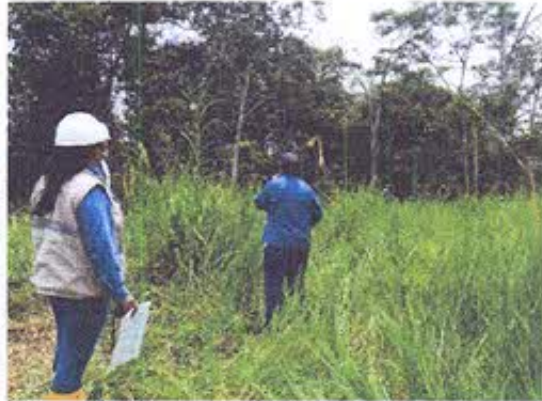
Foto 2.- Sector en donde se implantará la torre T250, se ejecutará rescate y monitoreo