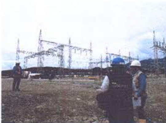
Foto 1.- Vista de la Subestación Bomboiza en donde se construye la torre T248A