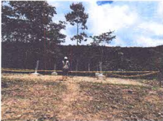
Foto 5.-T 257 fue construida sin monitoreo arqueológico

Instituto Nacional de Patrimonio Cultural