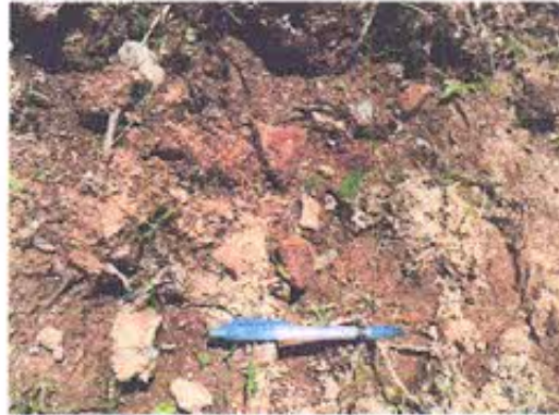
Foto 6.-Fragmentos cerámicos encontrados alrededor del área de la T257, durante la inspección