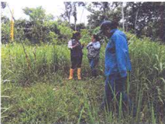
Foto 3.- Vista del área en donde se implantará T 252, se realizará monitoreo arqueológico.