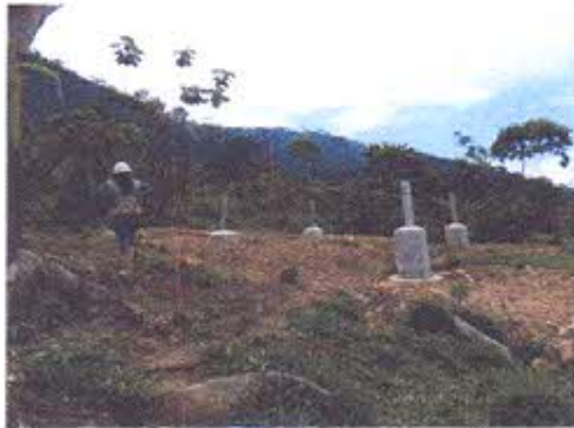
Foto 11.- Torre T275 construida sin la ejecución de un monitoreo arqueológico