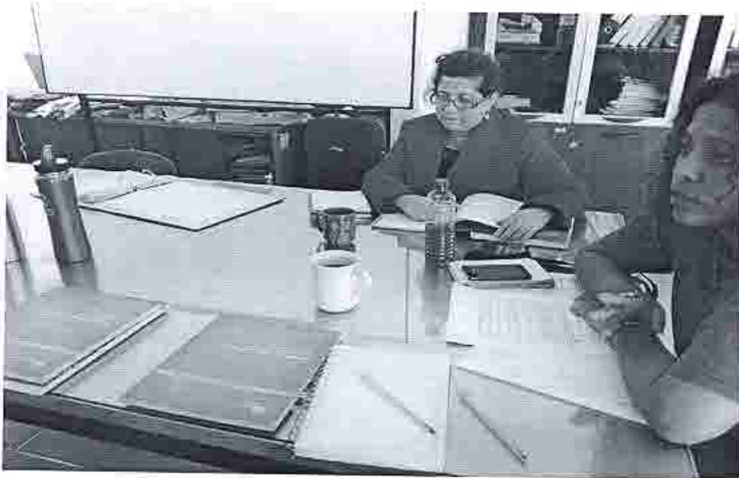
FOTO 02 Funcionarias del PCI de las Regionales 4 y 5 en capacitación del SIPCE.