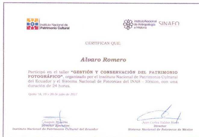
Imagen 3.- Certificado de asistencia del taller de Gestión de Patrimonio Fotográfico.