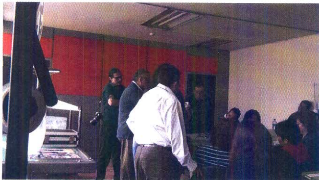
Imagen 2.- Sesión de trabajo en el laboratorio de Conservación Documental del Ministerio de Relaciones Exteriores- asistentes al taller de Gestión de Patrimonio Fotográfico.