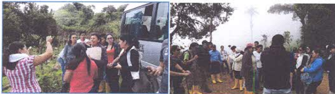
Puntos de observación de aproximación al sitio arqueológico

Desde aquí se hizo una innovación a la ruta pues basados en los principios técnicos de turismo se plantea la sugerencia de culminar el circuito sin retornar por los PO 5 y 4 hasta llegar a la salida o acceso inicial, sino salir desde el PO6 por un sector donde no hay estructuras hasta la alambrada que también conduce al culunco, aquí el GAD Municipal debe realizar una pequeña puerta desde donde los turistas deben salir hasta el paradero.