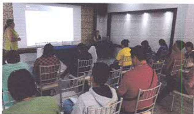
Conferencia en Machala

Se informó además al auditorio que en el 2012 el INPC DR7 en colaboración con el GAD Municipal de Huaquillas participaron en la delimitación del sitio en mención. Hay un levantamiento topográfico en el cual hay que definir un acceso independiente hacia el sitio y delinear la zona de influencia para sobre ello planificar una inspección. Es decir, el GADM de Huaquillas cuenta con la herramienta básica para realizar la zonificación e impulsar una ordenanza para el uso y regulación del suelo del conchal prehispánico Isla Seca.