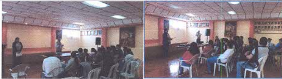
Charla preparatoria para el recorrido de campo

Este circuito es un recorrido básico, de contorno perimetral que tiene la finalidad de cuidar el sitio impidiendo el acceso directo de las personas sobre los graderios o estructuras de piedra restauradas, debido a que los cimientos se están deteriorando y por el momento no existe un plan de conservación ni recursos económicos que permitan intervenciones especializadas.