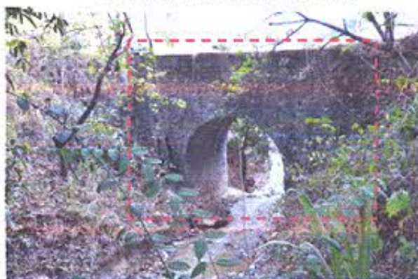
FOTOGRAFIA NRO. 3. IBI-07-11-50-000-000117 – Puente- Portovelo