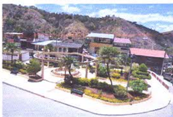
FOTOGRAFIA NRO. 4. IBI-07-02-50-000-000133 – Parque de Portovelo