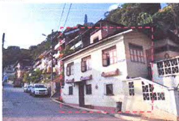
FOTOGRAFÍA NRO. 2. IBI-07-11-50-000-000050 la ciudad de Portovelo