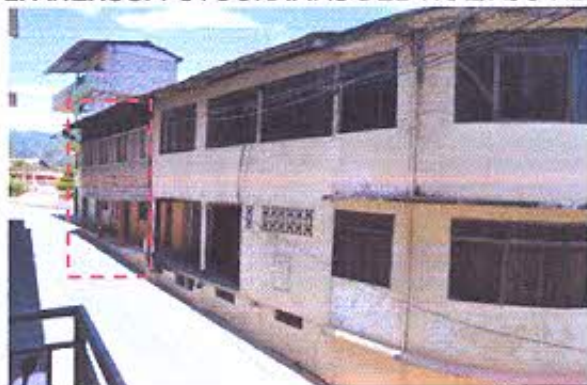
FOTOGRAFÍA NRO. 1. IBI-07-11-50-000-000089 de la ciudad de Portovelo