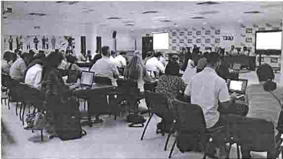
Fotografía Nro. 1, Aprobación del Reglamento General de Funcionamiento de la REIMAR.