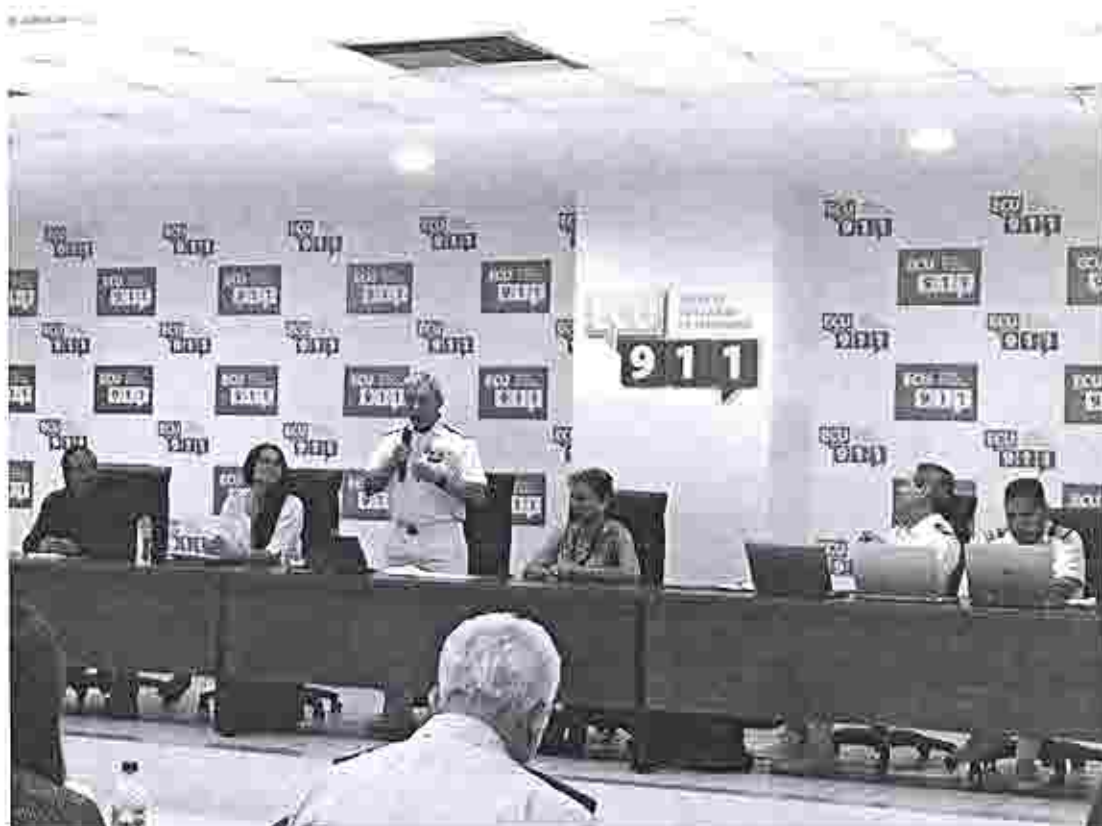
Fotografía Nro. 3, Posicionamiento del nuevo Directorio Ejecutivo de la REIMAR.