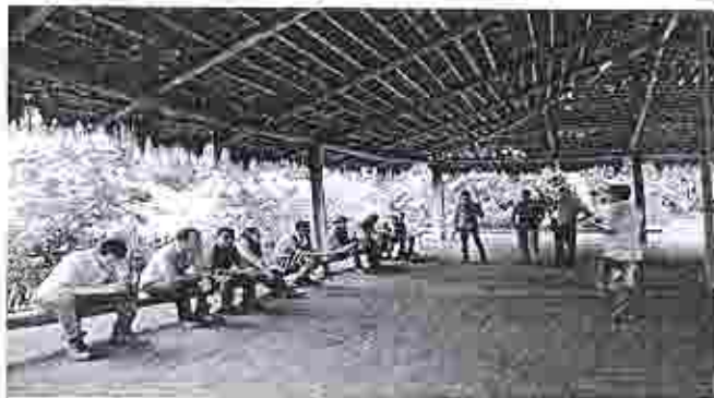
Reunión Centro Cultural Du Tenka.