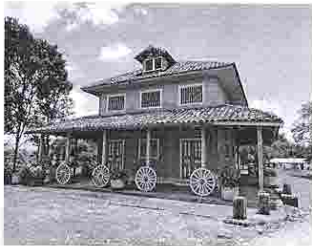
Inspección Casa Rosada, Santo Domingo.