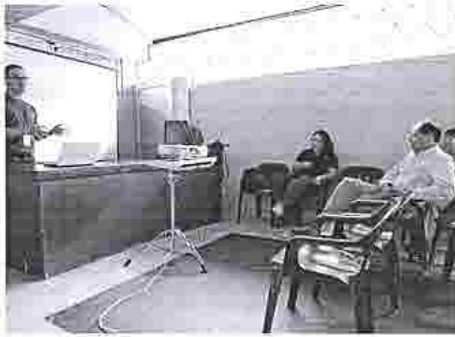
Capacitación a personal del GAD de Santo Domingo