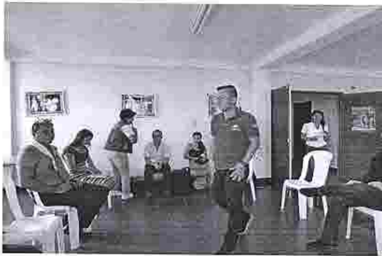
Reunión con el Gobernador Tsáchila, Javier Aguavil