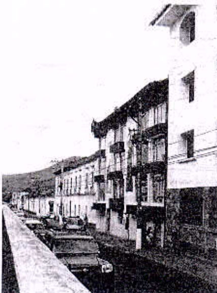
CASA FAMILIA GRIJALVA Y EDIFICIO CNT CENTRO HISTORICO DE IBARRA