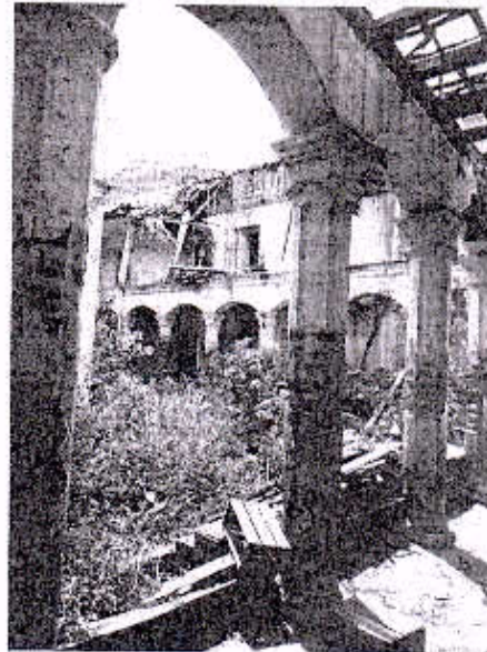
CASA FAMILIA GRIJALVA