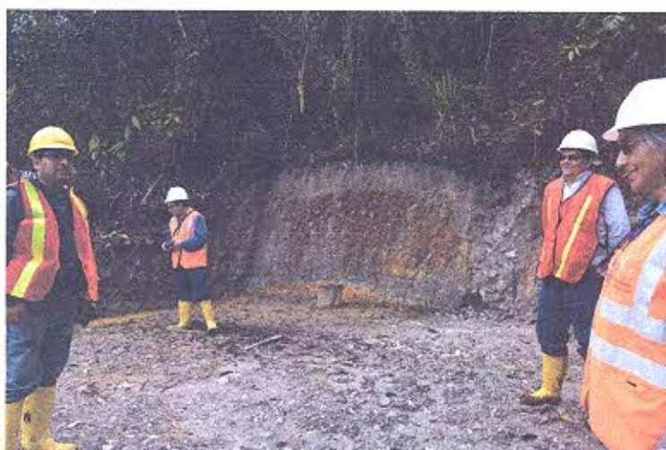
Fotografía 2.- Visita a la plataformas de la Zarza

El día 17 de julio del año en curso a las 09H00 el equipo acompañado de la arqueóloga de LUNDINGOLD nos trasladamos al proyecto minero La Zarza, lugar en donde se verificó que la construcción de las plataformas se realizan en conjunto con la intervención de un arqueólogo que realiza el respectivo monitoreo. Una vez finalizado el recorrido se retorna al campamento de la empresa para posteriormente a las 13H30 partir hacia la ciudad de Loja, en donde se arriba a las 17H30.