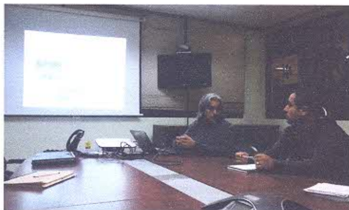
Fotografía 1.- Reunión con los representantes de LUNDINGOLD

El día 17 de julio del año en curso a las 09H00 el equipo acompañado de la arqueóloga de LUNDINGOLD nos trasladamos al proyecto minero La Zarza, lugar en donde se verificó que la construcción de las plataformas se realizan en conjunto con la intervención de un arqueólogo que realiza el respectivo monitoreo. Una vez finalizado el recorrido se retorna al campamento de la empresa para posteriormente a las 13H30 partir hacia la ciudad de Loja, en donde se arriba a las 17H30.