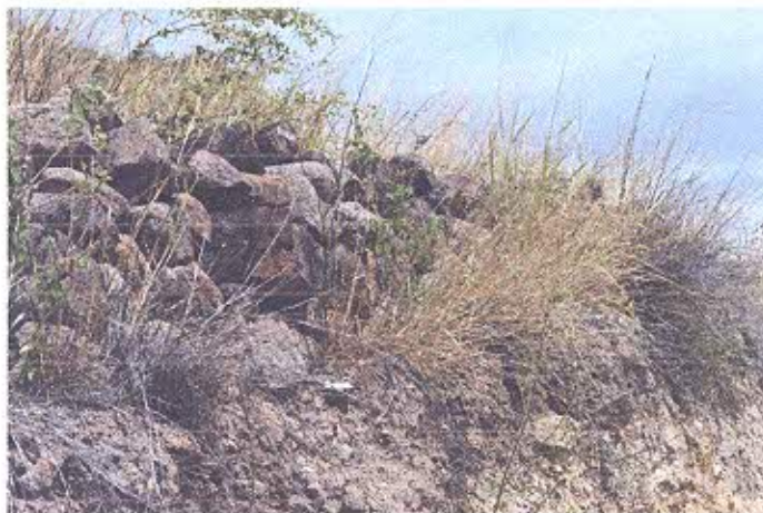
Foto 1.- Evidencia de muros en el margen de la vía hacia el sector de Corralejas.