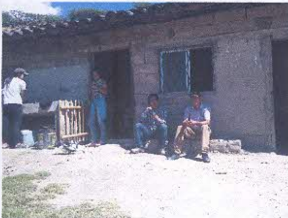
FOTOGRAFIA NRO. 1. Reconocimiento y registro de las tipologías arquitectónicas del barrio Cachipamba