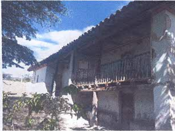
FOTOGRAFIA NRO. 3. Reconocimiento y registro de las tipologías arquitectónicas del barrio Cachipamba