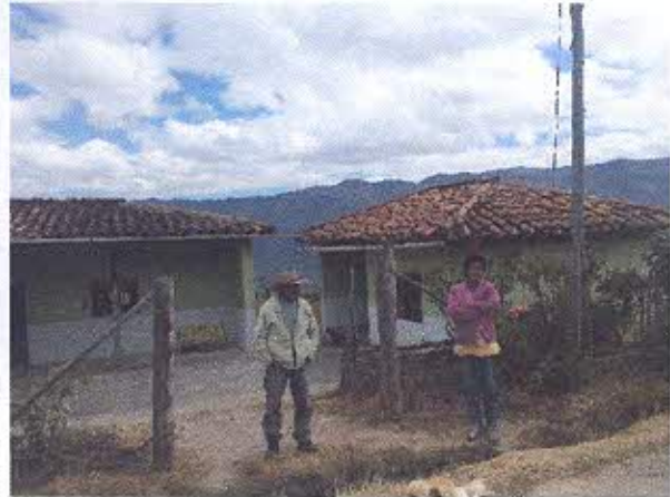
FOTOGRAFIA NRO. 4. Entrevistas con moradores del barrio Cachipamba