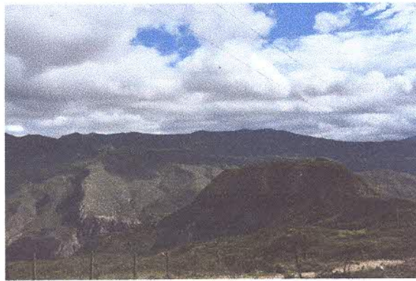
Vista General del sitio arqueológico Pustushio

Una vez realizada la debida explicación de las excavaciones que se realizaron por parte de la arqueóloga se procedió a ascender al denominada "Gran Putushio", cuya cima es un planicie con poca pendiente, se observaron las características arqueológicas y paisajísticas que están presentes. En la cima se evidencia la presencia de muros que conforman terrazas que por la condiciones de conservación son poco visibles. En la cima y a nivel superficial el material cerámico, lítico y óseo esta disperso, debido a la acción de "huaqueros".