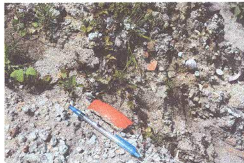
Evidencia de material cultural en la superficie.

Finalizado el recorrido y un análisis superficial para observar las condiciones en las que se encuentra, siendo urgente el establecer políticas para el resguardo de este sitio. Nos trasladamos al "Tablón Viejo", para observar los estudios en SIG realizados por la investigadora y tener presente la información ya existente y buscar aquellos puntos en los que no se intervenido en los diferentes estudios en el sitio, además buscando las diferentes posibilidades de contactos que puedan ser de ayuda para proponer posibles estudios complementarios en la zona.